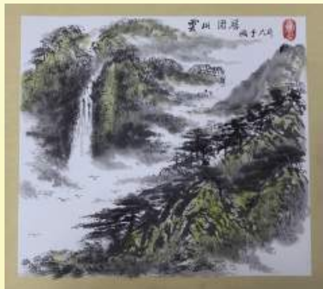
孔宪玉《云山固居》绘画类第三名